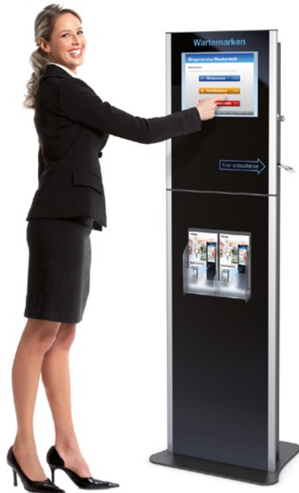
MITRA als Wartemarken-Terminal mit optionalem Standfuß MITRA receipt printer as a part of a waiting area management