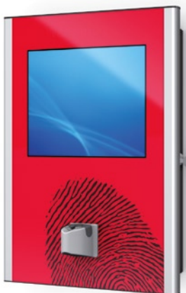
MITRA mit Fingerabdrucksensor und individueller Bedruckung MITRA with fingerprint sensor and individual printed front

The version with a receipt printer, card reader, etc. can be used as a ticket dispenser, for time recording, or for access control, for example.