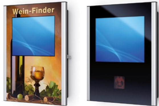
MITRA 15" mit individueller Beklebung (links) und als 19" Variante mit Barcode-Lesegerät (rechts) MITRA 15" with individual decal (left) and the 19" model with a barcode reader (right)