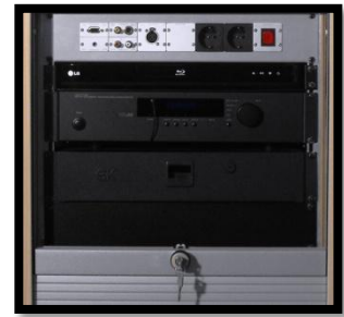
19" Anschlussblende, DVD, Verstärker, 19" Racklade

Sie können mit dem Medienwagen education Dokumentarfilme zeigen, Hörbücher abspielen (Diktat) oder stellen Sie den Medienwagen Ihren Schülern bei deren Referaten als schnelle Projektionslösung zur Verfügung.