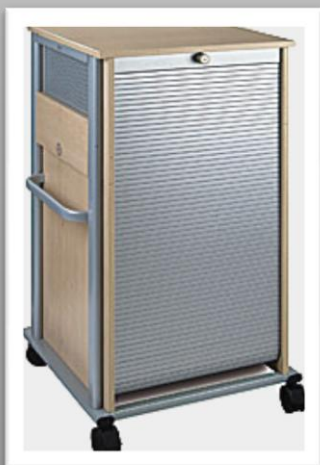
Schutz durch abschließbare Rollo