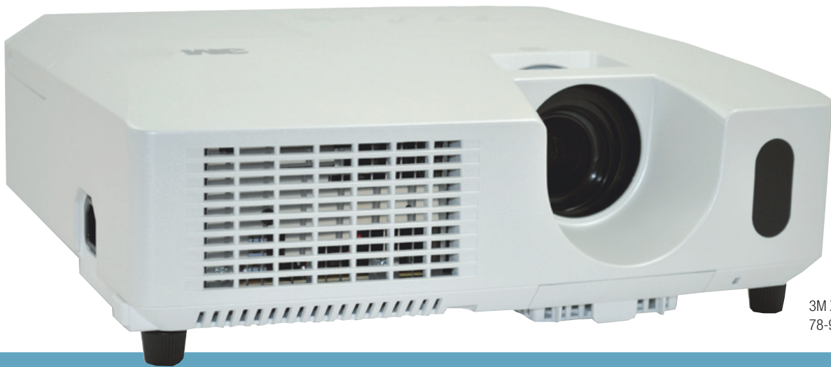
3M X31 Projektor 78-9236-7723-7

Mit einer Lichtstärke von 2700 ANSI Lumen sowie einem Kontrastverhältnis von 2000:1 ermöglicht der 3M Digital-Projektor eine außergewöhnliche Bildqualität. Zusammen mit der kompromisslosen Leistung und Zuverlässigkeit der 3M Produkte, führt die Netzwerkfunktion des X31 zu einem effektiven und effizienten Geräteinsatz und reduziert damit die Betriebskosten, die Ausfallzeiten und die Instandhaltungskosten. Zusätzlich ausgestattet mit einem Hybridfilter (bis zu 4000 Stunden Serviceintervall), stellt der X31 die optimale Lösung für jene Schul- und Geschäftsbereiche dar, in denen starke Leistung und minimale Betriebskosten zu einem günstigen Preis gefragt sind.