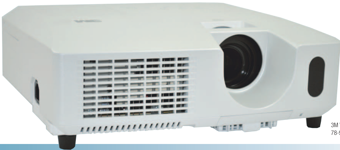
3M WX36 Projektor 78-9236-7720-3

Der Digital-Projektor WX36 bietet die perfekte Kombination aus Größe, Gewicht, Helligkeit und Kompatibilität. Mit 3000 ANSI Lumen, WXGA Auflösung und nur 3,6kg, ist dieser Projektor eine ausgezeichnete Wahl für jeden modernen Konferenz- oder Klassenraum, insbesondere dann wenn Kompatibilität mit Breitbildformatigen PCs, Laptops oder Video-Konferenz-Geräten gefragt ist. Er bietet das volle Spektrum an Anschlussmöglichkeiten, wie etwa HDMI, und ist darüber hinaus noch HDTV-tauglich. Der WX36 ist ein praktisch wartungsfreier Multifunktions-Beamer, der durch eine starke Leistung und geringe Betriebskosten überzeugt. Sein langlebiger Hybrid-Filter ermöglicht außerdem Reinigungsintervalle von beeindruckenden 4000 Stunden.